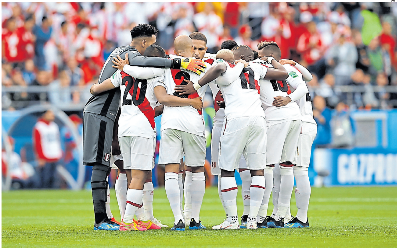
Los 23 jugadores que disputan el Mundial de Rusia también están incluidos en este ambicioso acervo, que abarca 90 años de la selección.

En ese acervo encontramos a ídolos de todas las décadas, como Lolo Fernández, Teófilo Cubillas, César Cueto, Franco Navarro y Nolberto Solano, así como algunos ca-